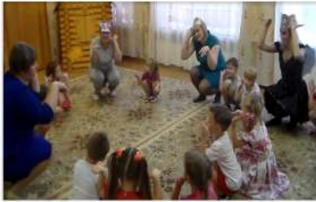
«Праздник подвижных игр»