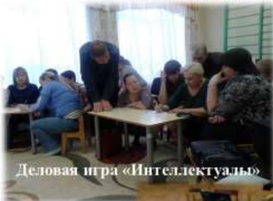
Деловая игра «Интеллектуаль»