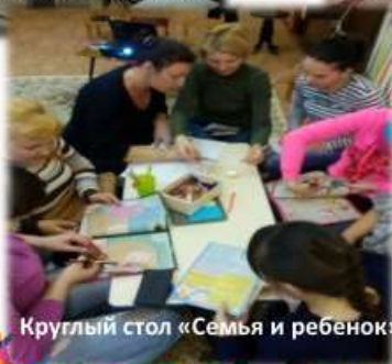
Круглый стол «Семья и ребенок»