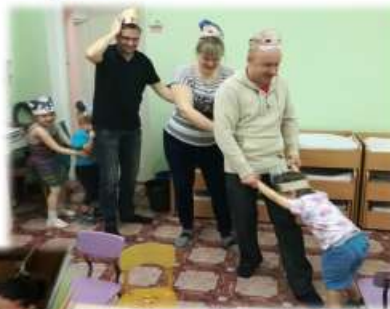
Квест-игра «Учимся играя»