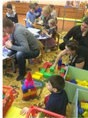
«Корпорация «Конструирующие дети»